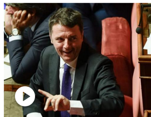
Scissione Pd, Renzi e il partito in 10 frasi, la videoscheda