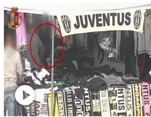
«Last Banner», fermati 12 ultrà della Juventus: accertate es...