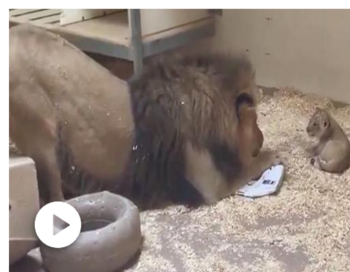
Il papà leone si avvicina al suo cucciolo per la prima volta...