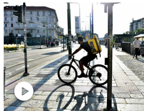
Caporalato digitale tra rider, account italiani venduti a mi...